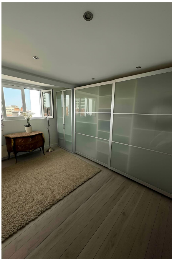
vue 12 : vue de la chambre